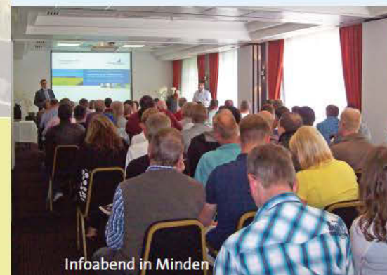
Infoabend in Minden

Die WestfalenBahn, der zukünftige Betreiber der „Ems- und Mittellandstrecken“, hat sich erneut in den Regionen präsentiert. Grund für die Reise war die Rekrutierung neuer Mitarbeiter/innen für die neuen Dienststellen Emden, Minden und Braunschweig. Auf speziellen Infoabenden in Emden, Minden und Braunschweig stellte die WFB ihr Ausbildungskonzept vor und stand auch für individuelle Fragen zur Verfügung. Über 350 interessierte Personen waren vor Ort und informierten sich über die Möglichkeiten einer Ausbildung zum/zur Triebfahrzeugführer/in.